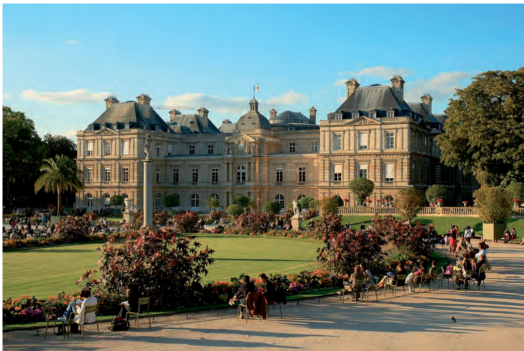
« Palais Luxembourg Sunset »